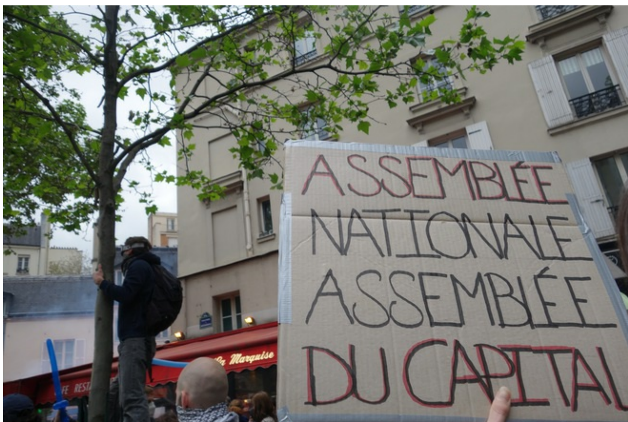
Paris, jeudi 12 mai 2016, manifestation contre la loi sur le travail.

Mais l'article 67 reste dangereux aux yeux des syndicats. Car il facilite un peu plus les licenciements en faisant de la baisse des commandes et de la baisse du chiffre d'affaires, en comparaison avec la même période de l'année précédente, des critères de licenciement. Concrètement, l'application de ces critères dépendra de la taille de l'entreprise : baisse du chiffre d'affaires au moins égale à un trimestre pour une entreprise de moins de onze salariés, deux trimestres consécutifs pour une société de onze à moins de cinquante salariés, trois trimestres consécutifs pour une entreprise de cinquante à moins de trois cents salariés et quatre trimestres consécutifs pour une société d'au moins trois cents salariés. Cette disposition pourrait être censurée par le Conseil constitutionnel en causant une rupture d'égalité des citoyens devant la loi (les salariés des grandes entreprises seraient plus protégés).