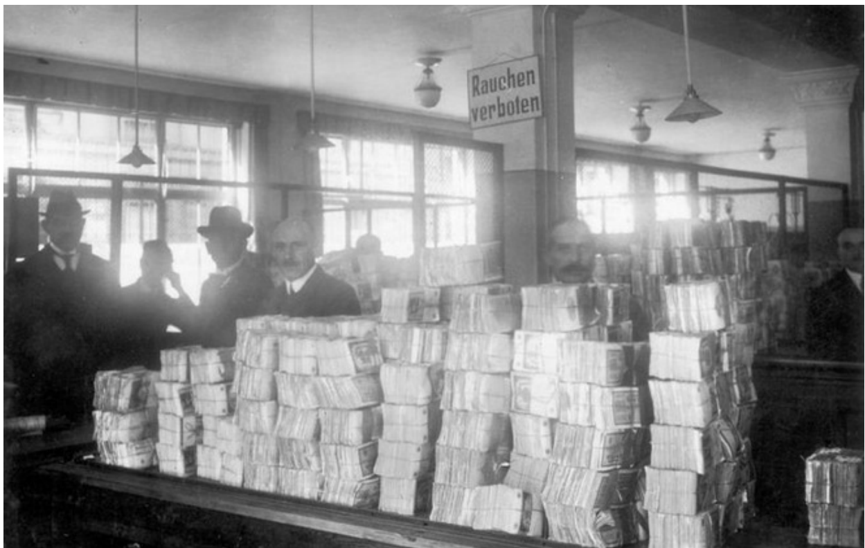
L'hyperinflation en Allemagne au début des années 1920.