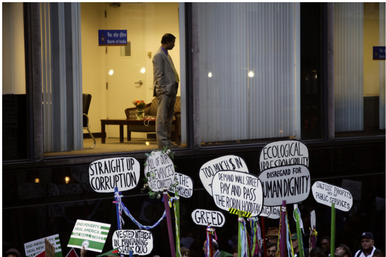
Manifestation d'Occupy Wall Street.

Si l'on suit les intuitions de Marx, on peut voir dans cette situation la manifestation de limites internes au capitalisme : les forces productives entrent en contradiction avec les rapports de production. Autrement dit, ce qui est en jeu dans le déploiement de l'économie numérique, c'est une reconfiguration d'ensemble des rapports socio-économiques. Hélas, pour l'instant, ce qui domine dans ce réagencement, c'est davantage des formes nouvelles de capture et de prédation que d'émancipation humaine. Mais il est trop tôt pour être résolument pessimiste. Il s'agit d'un processus historique long, dont on ne voit que les prémices.