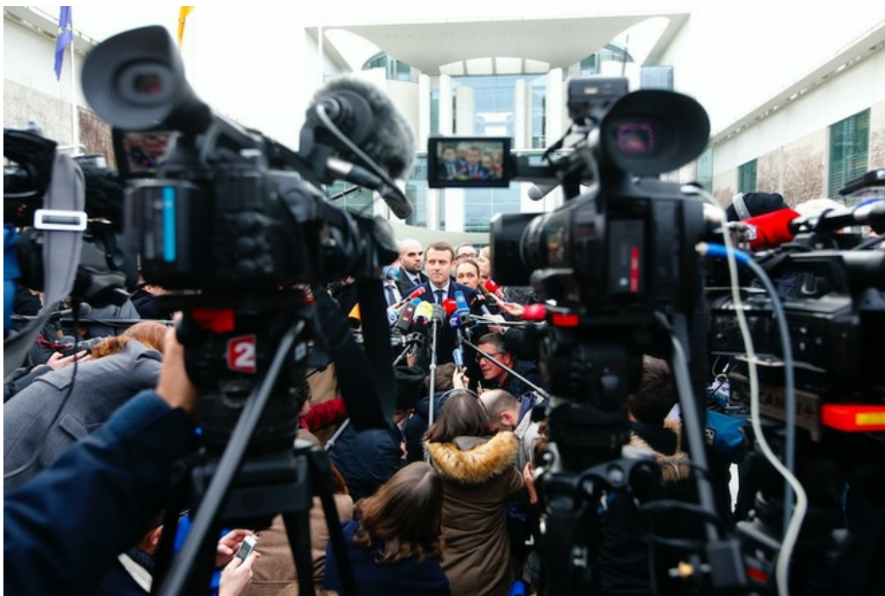
Emmanuel Macron devant la Chancellerie à Berlin, le 16 mars 2017

Ce ne sont pas les dominés qui sont les premiers responsables du sort qui leur a été réservé, ce sont ceux qui ont mené une politique qui, depuis les années 1980, a cherché à affaiblir matériellement et subjectivement les classes populaires. On le sait, on l'a répété : les politiques dites « de gauche » n'ont plus cherché à partir de 1983 à remettre en question la puissance du capital, elles ont visé à la renforcer, et ceci par le grand marché européen, la monnaie unique, la concurrence interne et externe entre salariats et fractions du salariat.