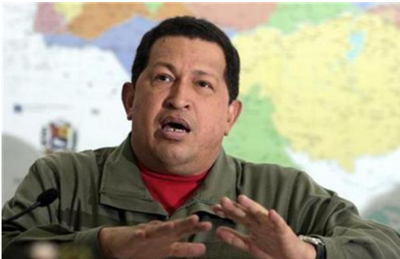
Hugo Chavez, en 2009

à une question posée par avance par les gouvernants.